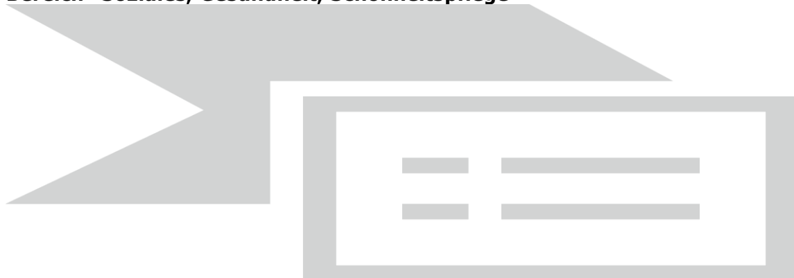
Abbildung 11: Entwicklung der Anzahl der unselbstständig Beschäftigten im Bereich "Soziales, Gesundheit, Schönheitspflege"

Zeiten des Umbruchs stehen den Geistlichen der katholischen Kirche bevor: Der noch bis mindestens 2025 andauernde Umstrukturierungsprozess bringt nicht nur neue Strukturen, sondern teilweise auch neue Organisationsformen des Priesterlebens mit sich. Auch bei muslimischen Geistlichen herrscht Umbruchstimmung: Neben Änderungen hinsichtlich der Organisation der Glaubensgemeinschaften wurde im Zuge des Islamgesetzes von 2015 beschlossen, dass ausländische bzw. vom Ausland finanzierte Imame nicht mehr in Österreich tätig sein dürfen. Seit Oktober 2017 kann an der Universität Wien ein islamisch-theologisches Bachelor-Studium absolviert werden, das auch als Berufsausbildung für islamische SeelsorgerInnen gilt.