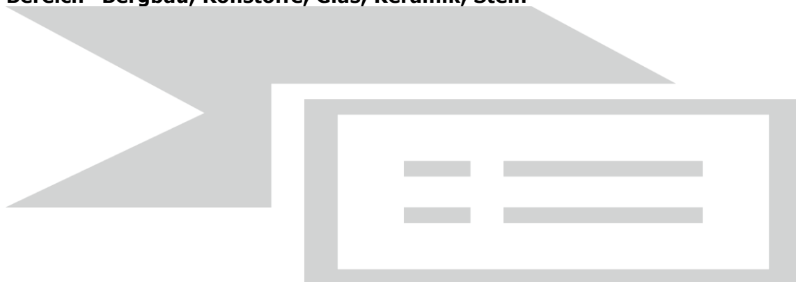
Tabelle 2.1: Bergbau, Rohstoffe, Glas, Keramik, Stein 16 ...in der Berufsobergruppe