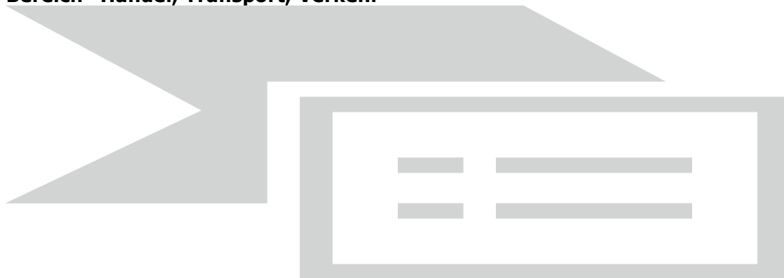
Tabelle 6.1: Handel, Transport, Verkehr 74