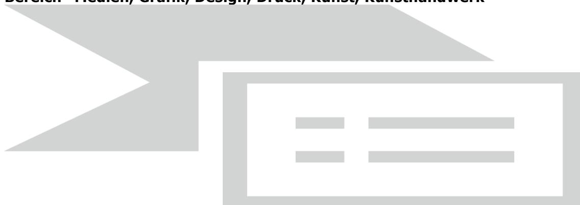
Tabelle 9.1: Medien, Grafik, Design, Druck, Kunst, Kunsthandwerk 109