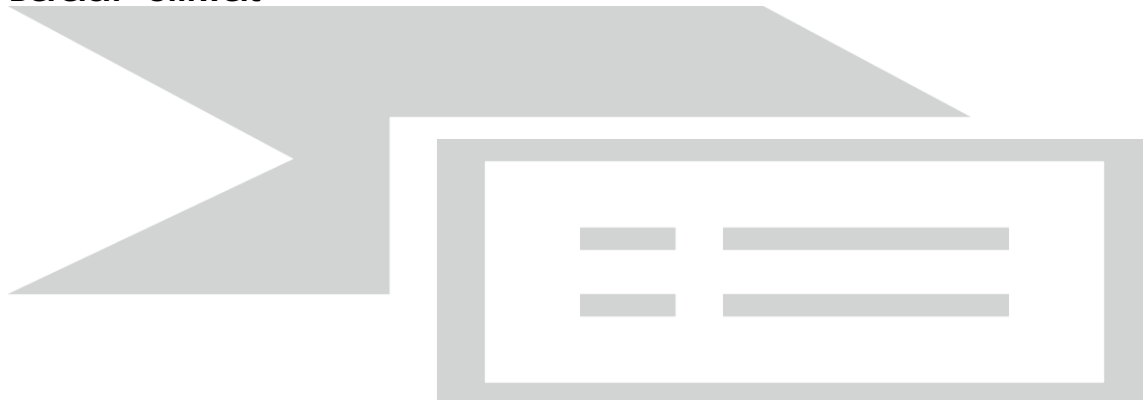
Tabelle 14.1: Umwelt176 ...in der Berufsobergruppe