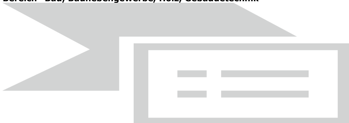
Tabelle 1.1: Bau, Baunebengewerbe, Holz, Gebäudetechnik 3