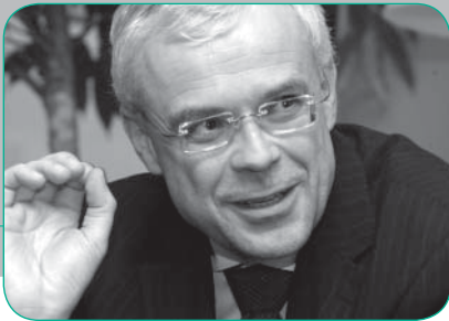
Vladimír Špidla , EU-Kommissar für Beschäftigung, Soziales und Chancengleichheit